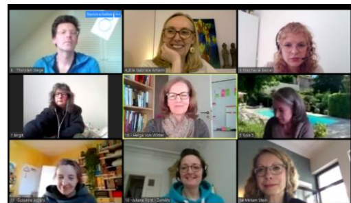
Ausbildung und Supervisionen über Zoom

360° Resilienz Facilitator | RZT® Grundlagen-Level